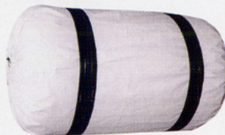
#300 ターポリンカバー付